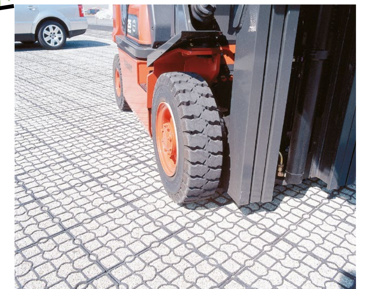
Passage d'engins lourds, nombreuses rotations - TE50