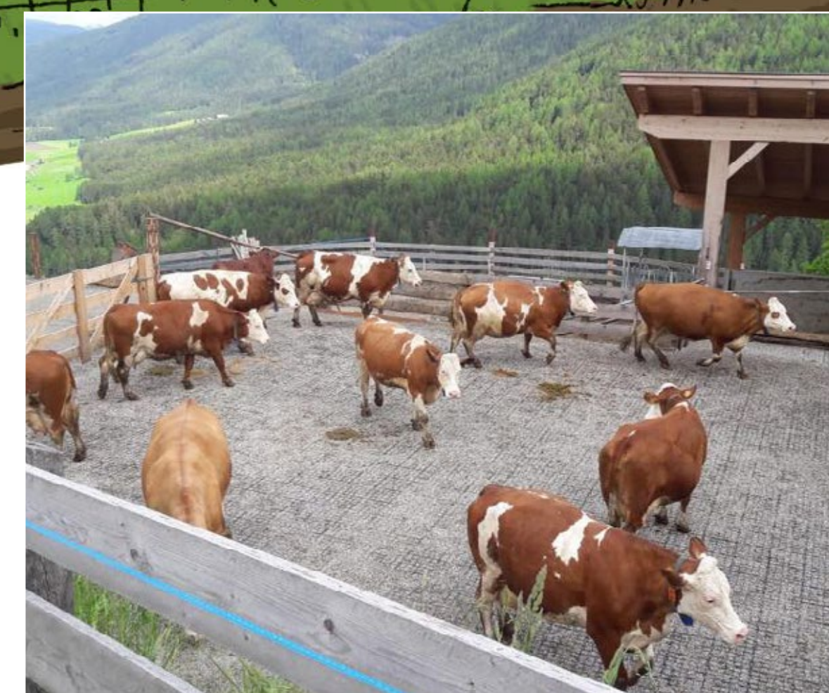
Entrées de pâtures - TE40