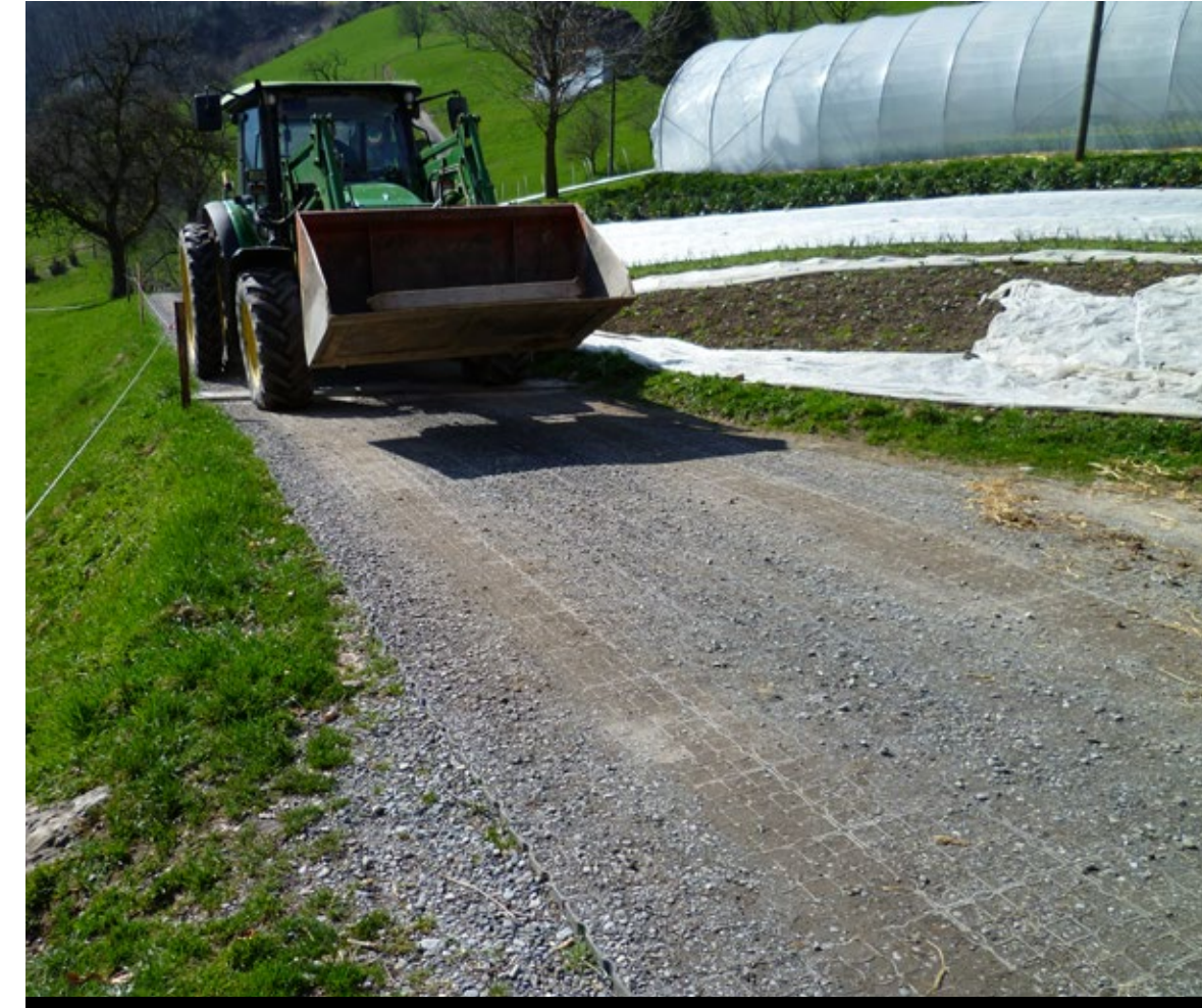
Aire de stockage pour les engins - TE50