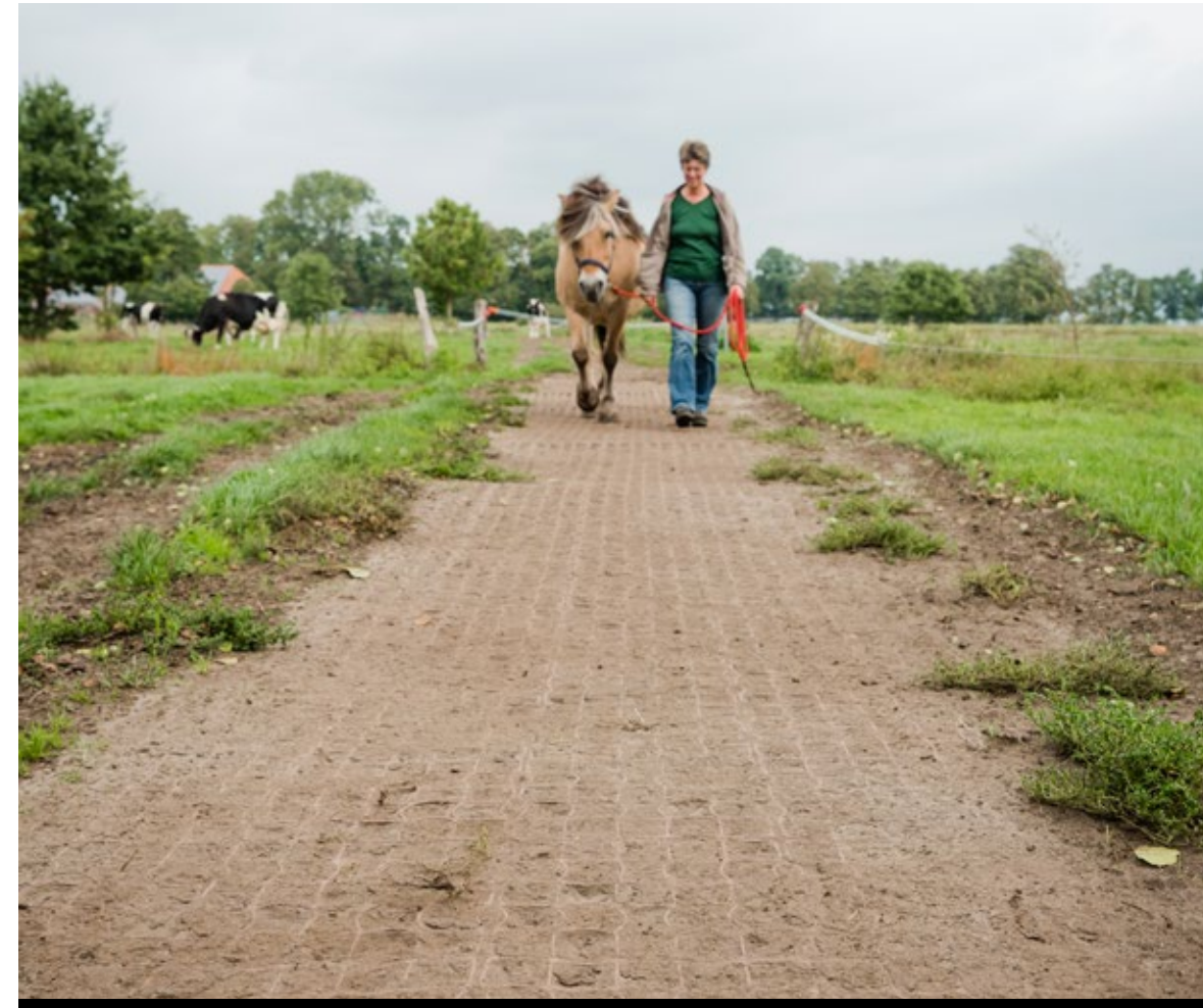
Chemins piétons - TE30