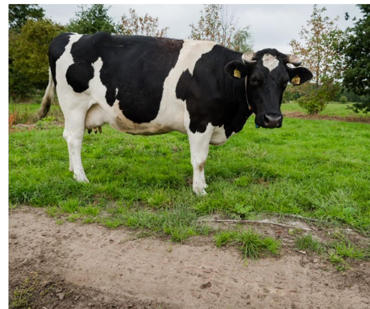
Zones à fort piétinement, râteliers, abreuvoirs - TP40