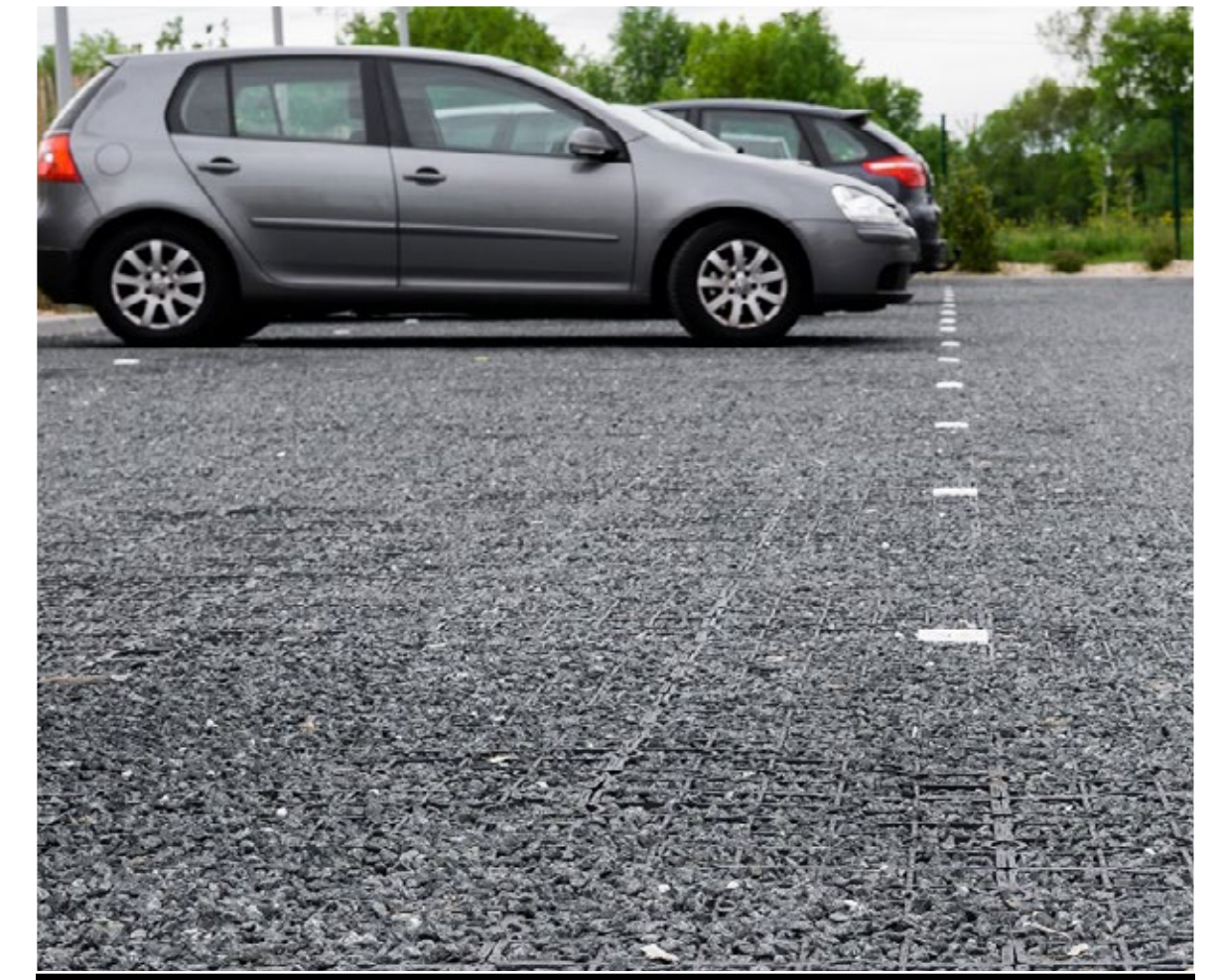
Parking véhicules légers - TE40